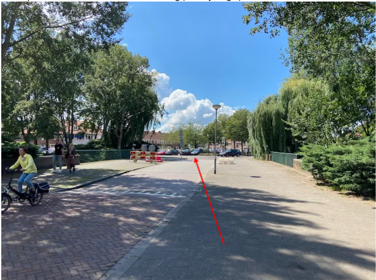
Gratis parkeren aan de overkant van de brug (Weerijssingel)